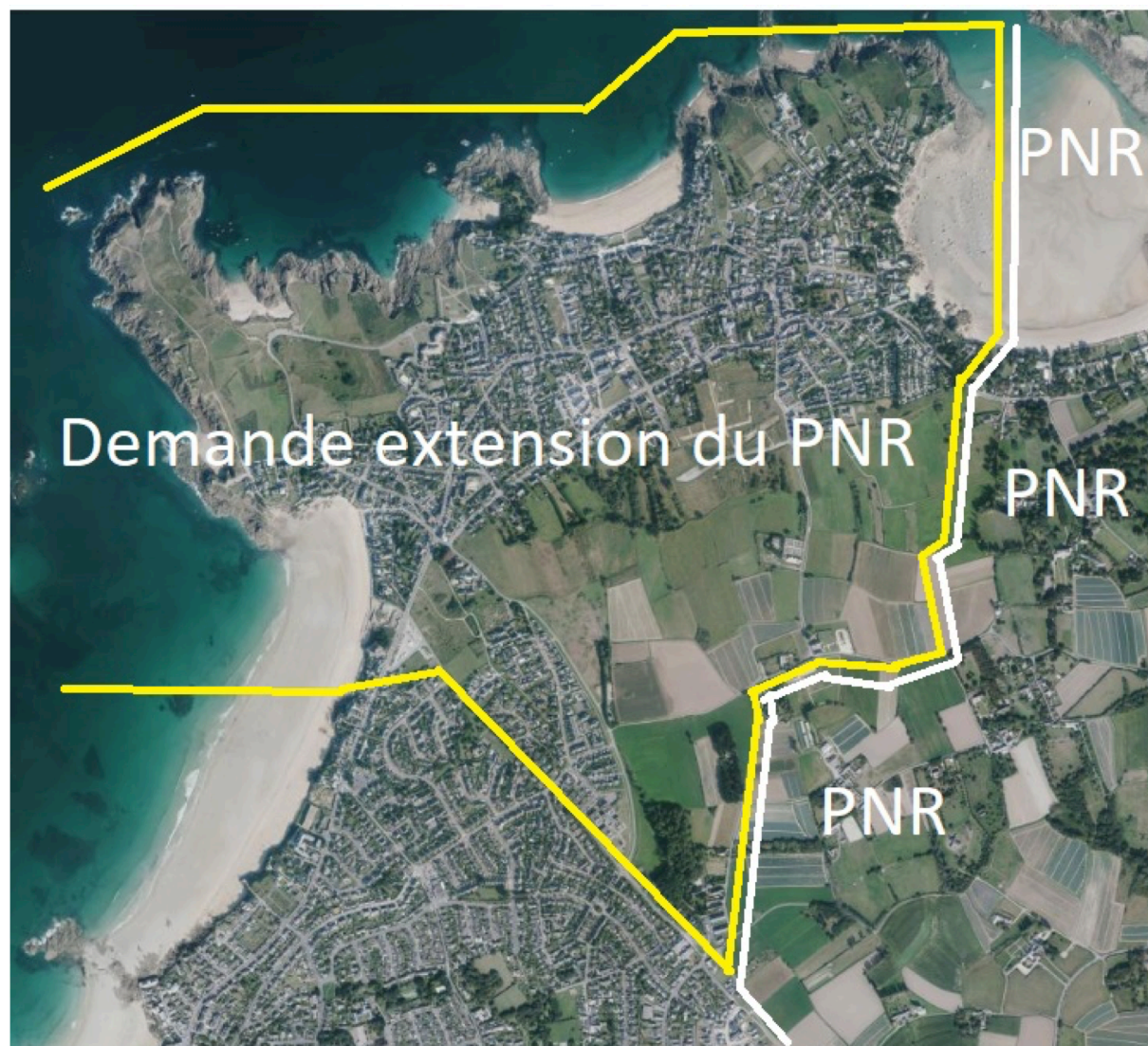
La demande d'extension du périmètre du PNR présenté par Rothéneuf Environnement

Avec cette mobilisation, l'association Rothéneuf Environnement souhaite que le secteur de Rothéneuf bénéficie de ce prestigieux label d'appartenance au Parc Naturel Régional Rance-Emeraude, qui l'engagera dans un projet de développement durable, dans le respect de ses patrimoines, et au bénéfice des générations actuelles et futures