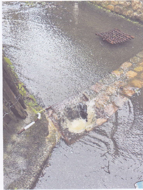
Inondation Rue du Commandant l'Herminier – 17 janvier 2024

Comptant sur une réponse positive de votre part, je vous prie d'agréer, monsieur le vice-Président, l'expression de mes salutations distinguées.